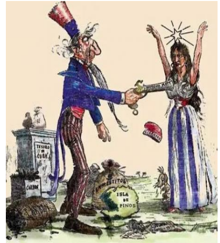
Adaptación de la Enmienda Platt, de 1901.